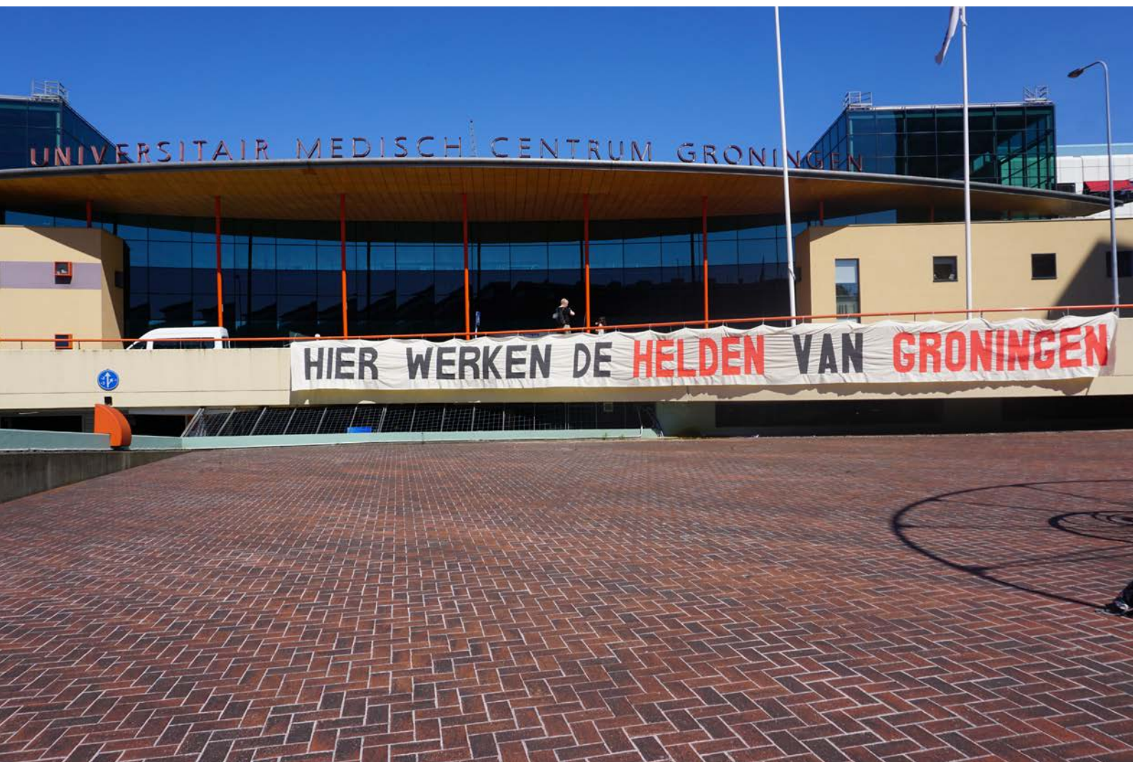
Actie voor steun aan werkers in de zorg