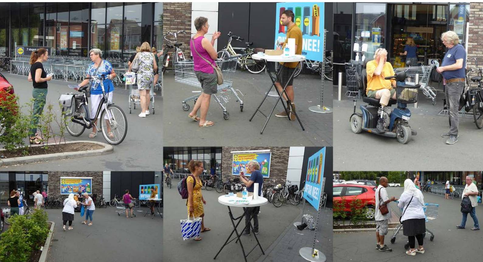
Actie: 'Zeg NEE tegen DIFTAR'