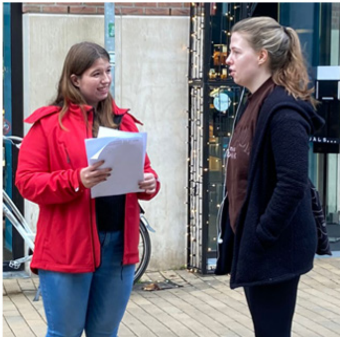
Actie 'Wie is die Horrorhuisbaas van Groningen?'