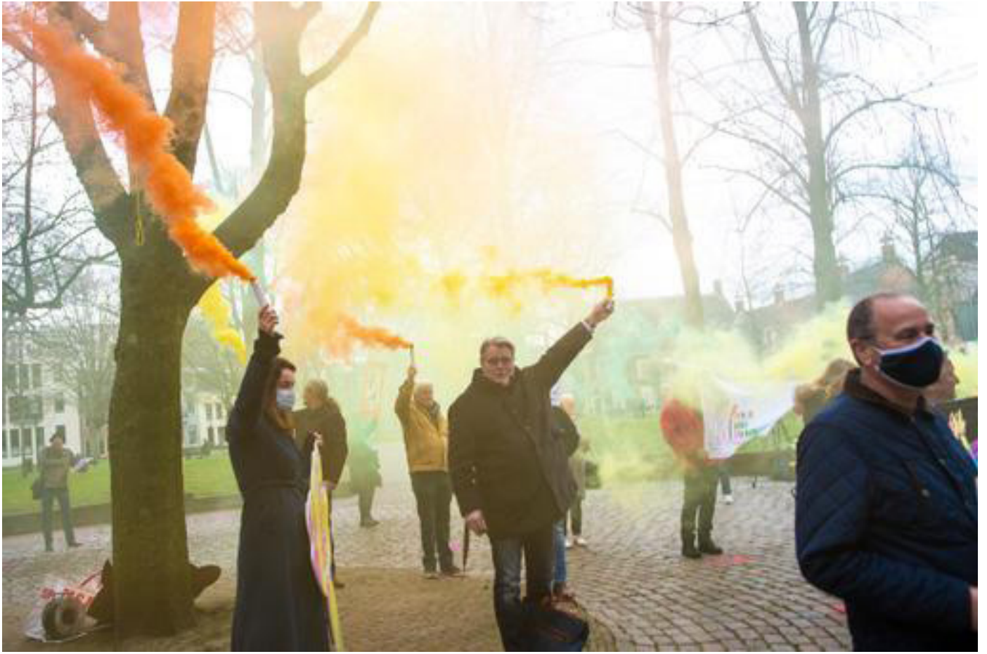
Fakkelprotest bij het Provinciehuis