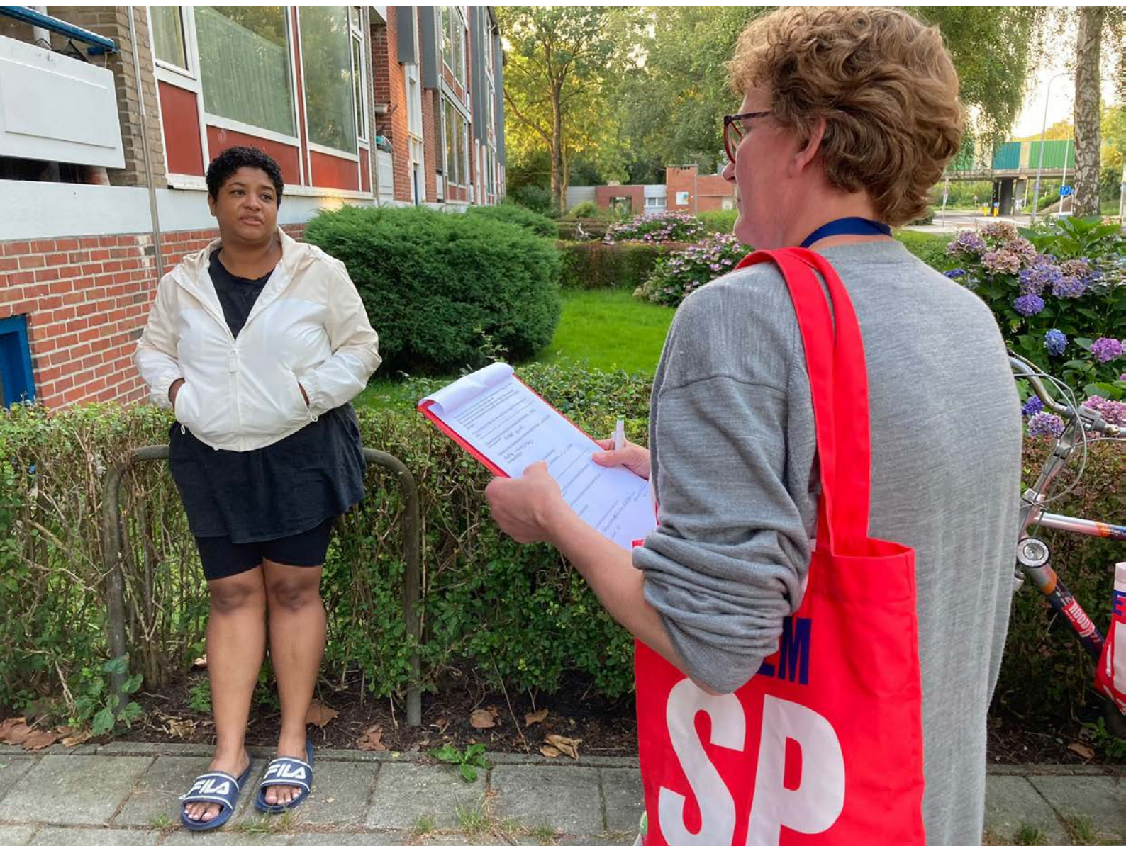
Bewonersactie in Selwerd