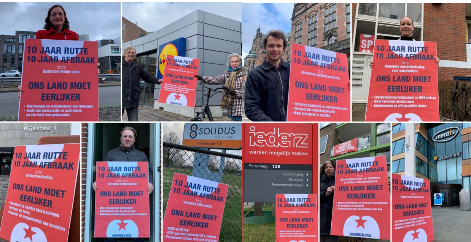
Actie Tweede Kamerverkiezingen: '10 jaar Rutte, 10 jaar afbraak'