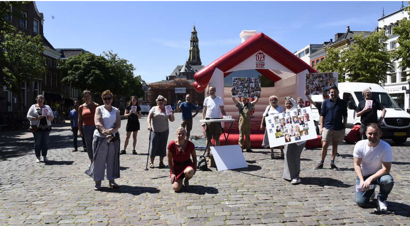
Huurdersactie: '0% is genoeg'