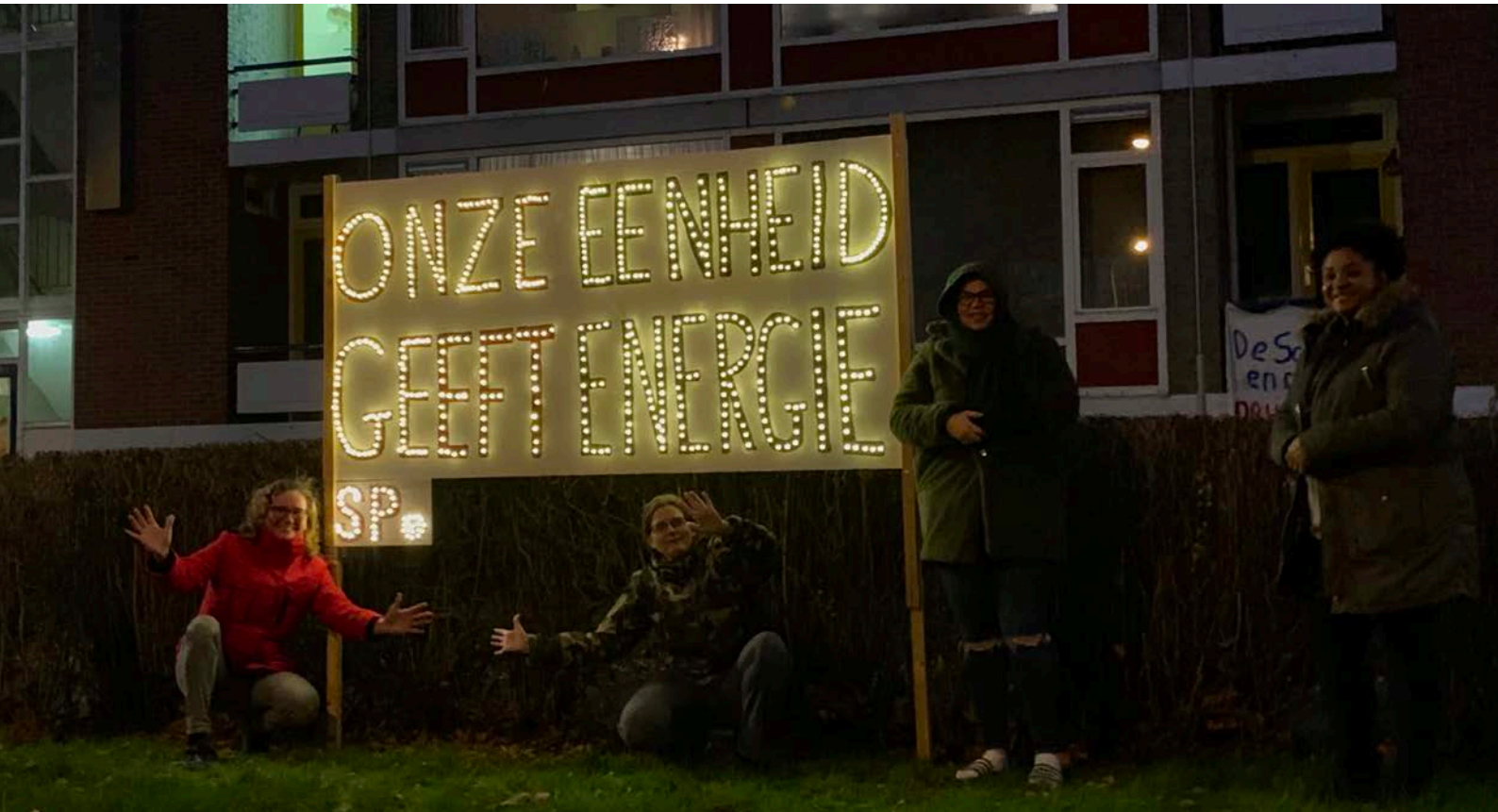
Actie: 'Onze Eenheid Geeft Energie'